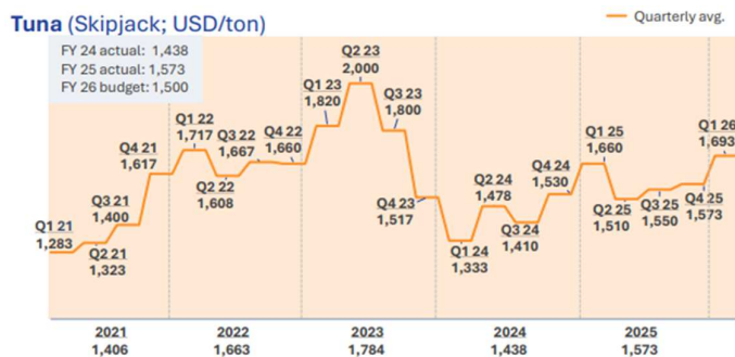
CHART 1: Tuna Price (USD/Ton)