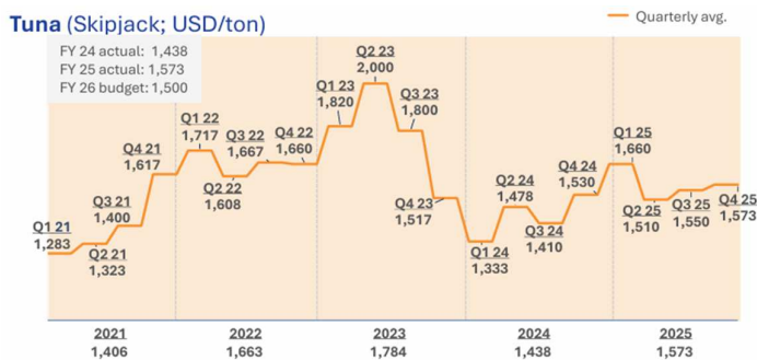
CHART 1: Tuna Price (USD/Ton)