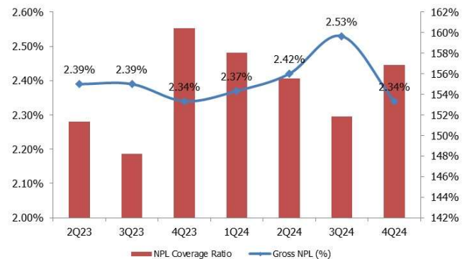
CHART 2: NPL coverage ratio and gross NPLs