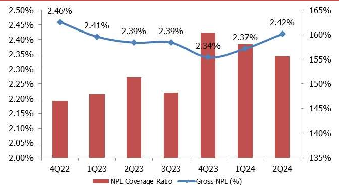
CHART 2: NPL coverage ratio and gross NPLs