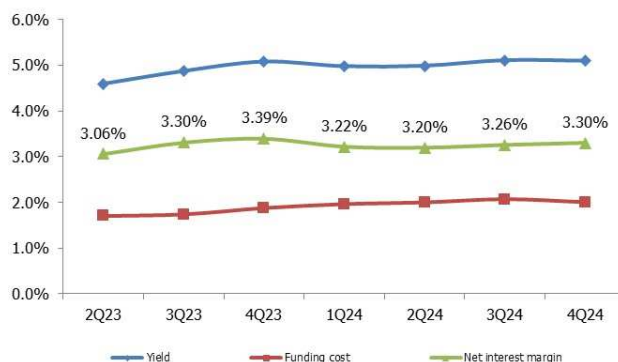
CHART 1: Yield, Funding cost and NIM