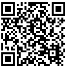
เอกสารการประชุม

จึงขอเรียนเชิญท่านผู้ถือหุ้นเข้าร่วมประชุมตามวัน เวลา และสถานที่ดังกล่าวข้างต้น หากท่านประสงค์จะแต่งตั้งให้บุคคลอื่นเข้าร่วมประชุมแทน โปรดกรอกข้อความและลงนามในหนังสือมอบฉันทะตามที่แนบมานี้ และส่งหนังสือมอบฉันทะพร้อมเอกสารที่กำหนดให้ประธานกรรมการหรือบุคคลที่ได้รับมอบหมายจากประธานกรรมการก่อนการเริ่มประชุม